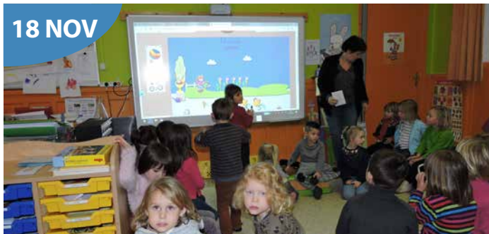
Tableau numérique interactif

Un tableau numérique interactif, financé par la Mairie et l'association des parents d'élèves, a été installé dans la classe de moyenne section de maternelle de l'Ecole du Centre.