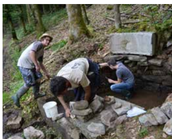
Restauration de la fontaine Pauline

L'assemblée s'est conclue par une projection de vidéo, rétrospective du voyage de l'association en 2017 à Meisenthal, puis le verre de l'amitié.