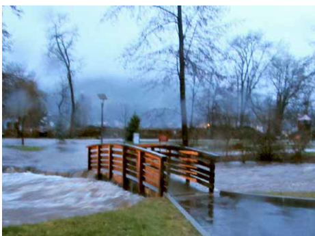
Ile aux Enfants