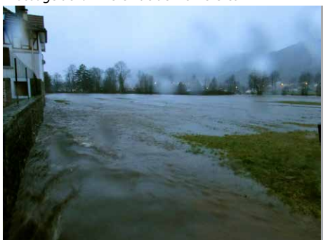
Rue de la Croix