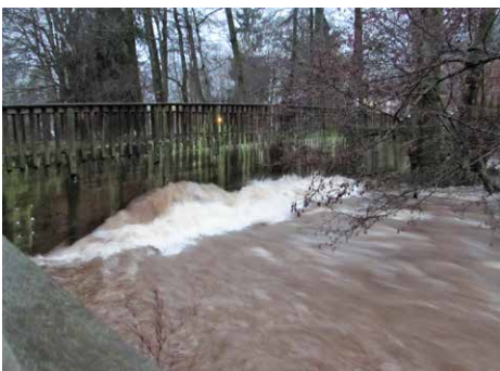
Passerelle des Epinettes