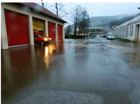
Rue des Ateliers Municipaux