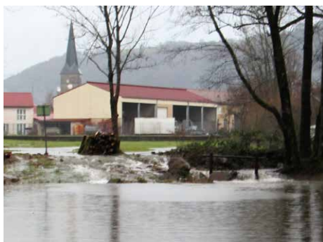
Etang de la Drague