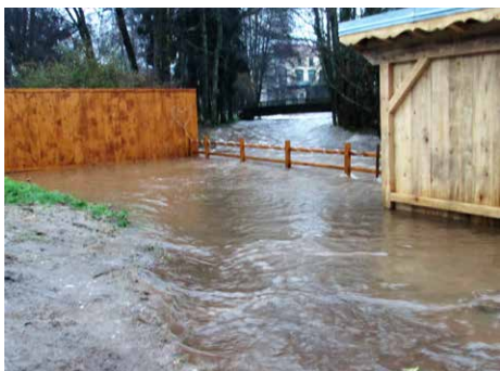
Passage de la rivière Rue de Plombières