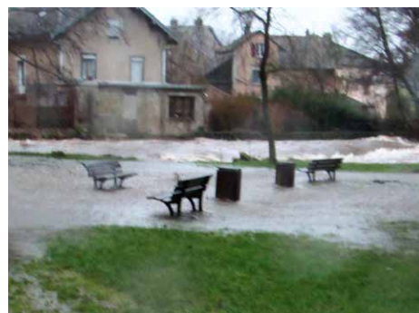
Parc des Epinettes