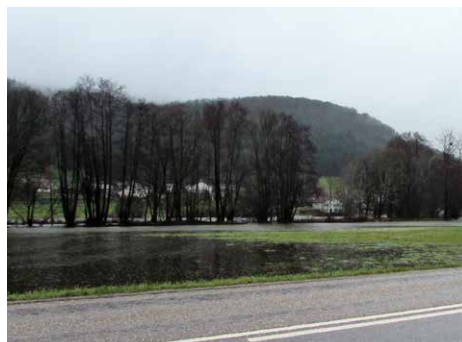
Route de Fougerolles